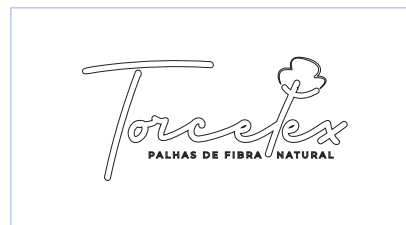
Não utilizar outline