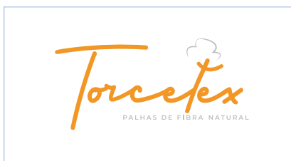
Não desalinhar elementos