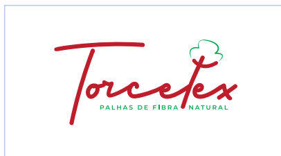
Não alterar as cores