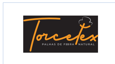
Não aplicar molduras próximas ao logo