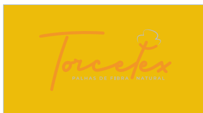
Não aplicar sobre fundos que não apresentam contrastes visuais suaves